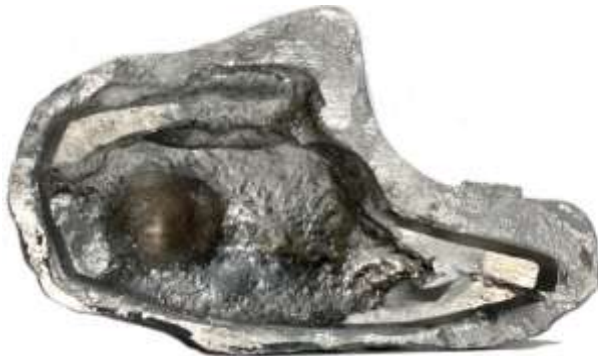
Wiking - Modell

Auch hier wieder die Neuauflage durch Dr. Grope zwischen 1987 und 1991, anfangs in Metall. Unterscheidungsmerkmal zur Wiking-Erstaufgabe ist eine umlaufende Nut im Sockelboden und farblich geänderte Details, wie z. B. die Laterne in weiß.