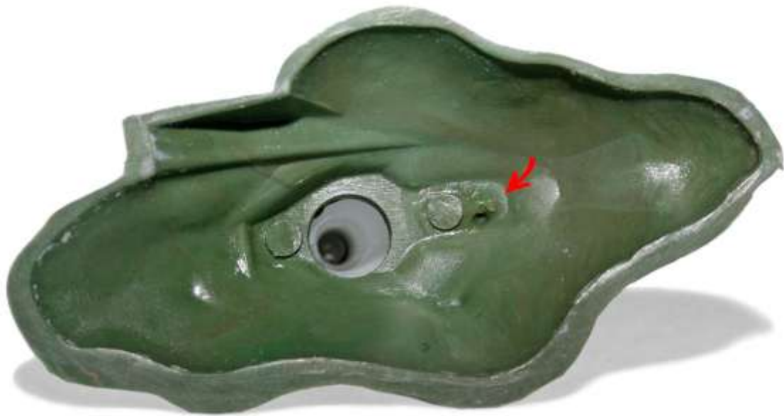
Die Unterseite mit der Form-Nummer 2

Dieser Groppe-Turm hat sehr viel Ähnlichkeit mit zwei Rautenberg-Modellen, bezogen auf die Laterne. Im Katalog wird sie als transparent, silbern, beschrieben. Das hat zweifellos etwas.... Schaut man sich die Groppe-Version der 622 an, sind dies Modelle aus eben der Groppeproduktion. Womit wir ungewollt wieder beim leidigen Thema „eventuell Vorserie“ wären. Dem normalen Sammler war damit noch nie wirklich gedient.