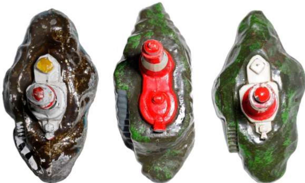
Links der erste Turm, in der Mitte die 624, rechts die 622

Es ist für mich unverständlich, warum bei diesem Modell lediglich auf den Standort des Turms, nämlich rechts von der Treppe, abgestellt wird. Im Haevecker sind es zwei Zeilen, bei Leinhos entfällt er als eigenes Modell ganz. Das Modell weicht aber erheblich von H. 622 ab, hat zweifellos eine eigene Form.