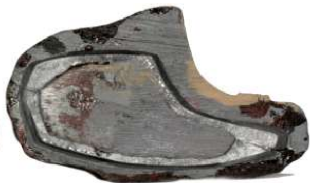
Grope - Modell

Bei identischen Abmessungen bringt das Modell satte 139 Gramm auf die Waage.